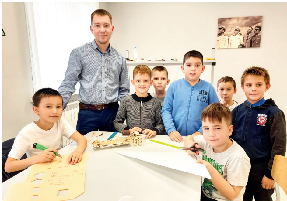
■ “Техник модельләштерү” түгәрәгендә.

“Техник модельләштерү” түгәрәген башлангыч класс малайлары үз итә. Программа нигезендә ракета, авиа, авто, судомодельләштерү серләренә өйрәнәләр. Гап-гади кәгазьдән башлап,