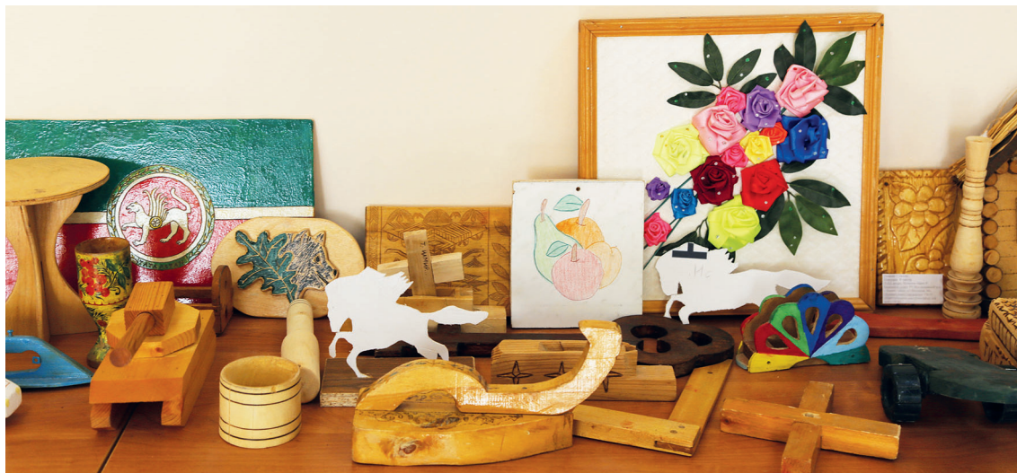
■ Балаларның кул эшләре.

– Мөмкинлекләре чикле балалар да үзләрен эзерлек дәрәжәсә, сәләтләре, мөмкинлекләре буенча да төрле. Дәрестән тыш эшчәнлеккә