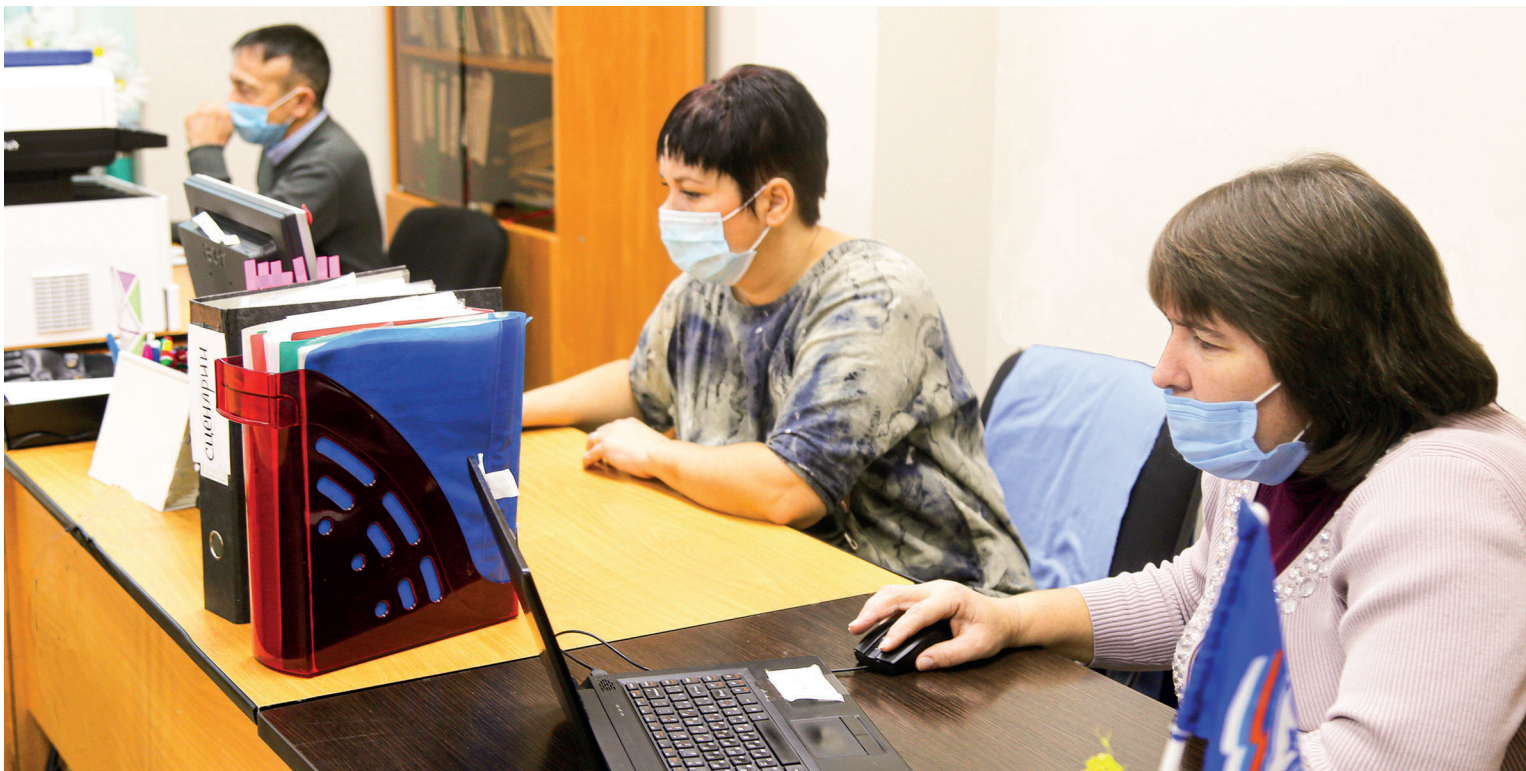
Этнодиктант язу мизгелләре.

5 ноябрьдә “Мизгел” яшьләр үзәгендә узган онлайн-диктантта жырлегебездәге төрле милләт берләшмәләре вәкилләре – 30га якын кеше катнашты.